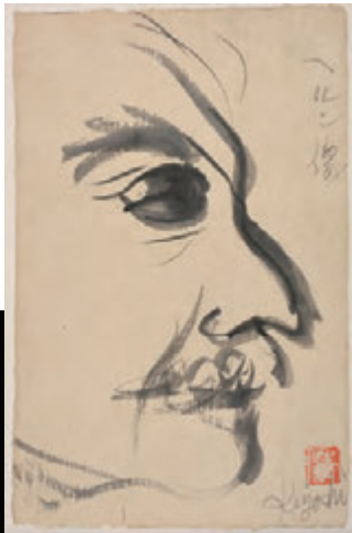
・「ヘルン像」小泉清 1950 年 墨・紙 小泉八雲記念館所蔵

記念事業の一環として、ハーンから学ぶ「現在（いま）に生きるハーン」と題して、八雲が発信した文化資源を再認識するとともに次世代を担う青少年がハーンの世界について学ぶ機会として、小泉八雲の名作『怪談』を漫画で描く作品を募集します。