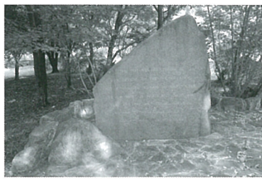
▲「極東の将来」の碑文